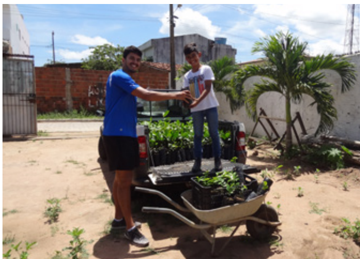
Freiwillige Helfer bei einer Verteilungsaktion von Setzlingen.

„Dazu bieten wir unter anderem CO 2 -Kompensation durch Bäume und die Ausstellung von entsprechenden Zertifikaten an.“