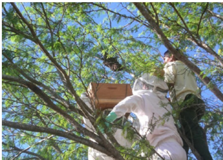
Unsere Imker bei der Honigernte.

In Deutschland haben wir unsere Webseite neugestaltet und versuchen aktiv und gezielt Spender zu werben ( www.brasiil.org ). Dazu bieten wir unter anderem CO 2 -Kompensation durch Bäume und die Ausstellung von entsprechenden Zertifikaten an. Die Pflanzung eines Setzlings pro Tag (11€ monatlich oder 130€ jährlich) findet großes Interesse. Sehr dankbar sind wir für die großartige Unterstützung des Pizza-Herstellers Gustavo Gusto: neben der Finanzierung von 90.000 Bäumen pro Jahr sind wir durch Werbung auf den Pizzakartons und die Aktion »Baumbäcker« einer breiteren Öffentlichkeit bekannt. Dadurch hoffen wir, deutschlandweit neue Förderer und Kooperationspartner zu finden.