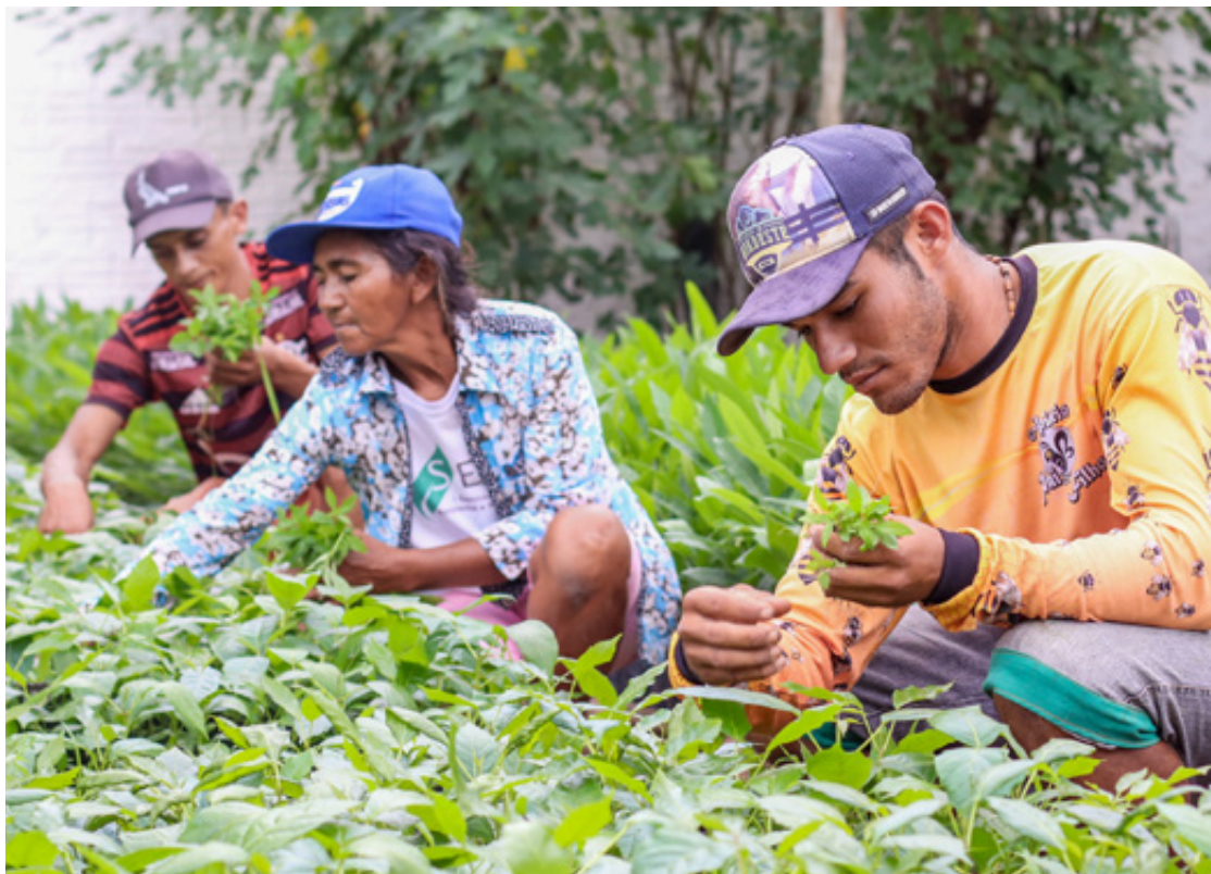
Unsere Baumschule mit frisch gezüchteten Baumsetzlingen.