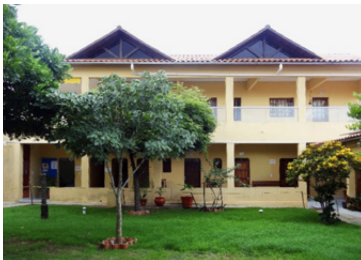
Unser Bildungszentrum: durch Vermietung der 13 Zimmer finanzieren wir den Großteil unserer Ausgaben vor Ort.

Wir sind stolz auf Fortschritte, die wir in Brasilien trotz Corona erreicht haben: unsere Produktion an Setzlingen und Honig haben 2020 neue Rekordwerte erreicht, unser Bildungszentrum in Araruna hat sich durch Mieteinnahmen größtenteils (zu 90%) selbst finanziert, und die Gesamtproduktion seit Vereinsgründung ist auf über 736.000 Bäume angewachsen. Wie immer waren Wartung und Aufrechterhaltung bestehender Projekte, insbesondere im Bereich Wasser, eine unserer Hauptaufgaben. Leider konnten pandemiebedingt keine Kurse und Schulungen stattfinden.